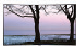
QLED-TV Q78C 165**